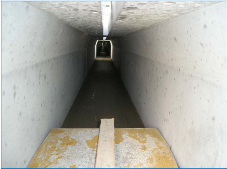
目地モルタルを 引いている状況 (こちらは、水を含ませた 状況)