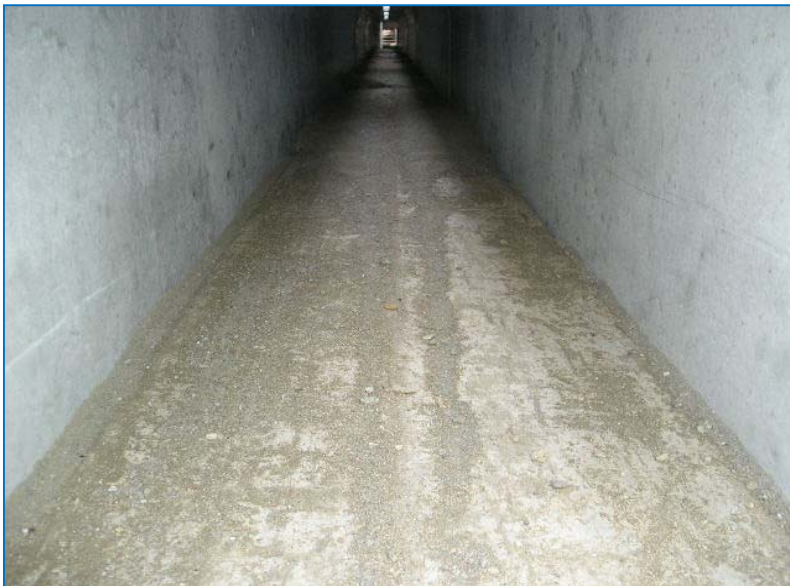
目地モルタルを すき間に落とし込んだ後の 状況